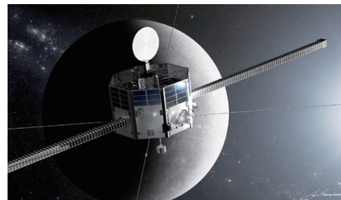
JAXAが担当する 水星磁気圏探査機(MMO) (全質量：約285kg、観測装置質量：約45kg)

MPO spacecraft (ESA) for studying Mercury's surface and internal structure will enter polar orbit at an altitude of "400km×1,500km". The MMO spacecraft (JAXA), for studying magnetic fields and the magnetosphere, will enter polar orbit at an altitude of "400km×12,000km" - outside the MPO's.