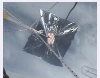
ソーラーセイル膜面展開試験 Deployment of solar-sail membrane