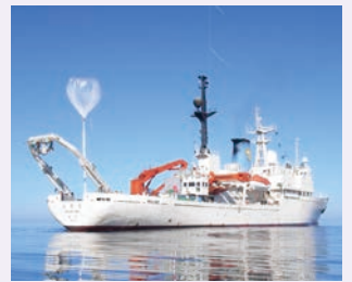
太平洋赤道上の成層圏大気採集 Stratospheric air sampling over the equator